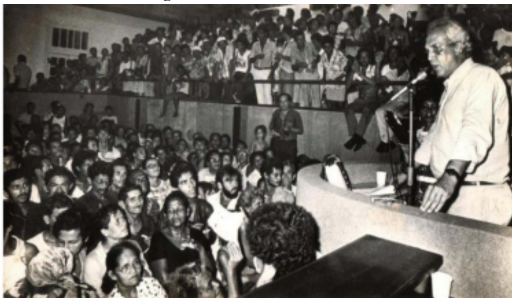
Figura 2: Assinatura da Lei do PREZEIS

Ele atuava no acompanhamento jurídico do conflito fundiário e aliado com os movimentos populares, elaborou a minuta do projeto do Plano de Regularização das Zonas Especiais de Interesse Social (PREZEIS), onde descrevia um conjunto de normas, procedimentos e mecanismos para o reconhecimento de outras áreas faveladas como ZEIS. Foram realizados diversos debates e negociações, sendo o texto final elaborado em março de 1987, quando o então prefeito da Cidade do Recife, Jarbas Vasconcelos, sanciona a Lei do PREZEIS – Plano de Regularização das Zonas Especiais de Interesse Especial (Lei 14.947/87). (Figura 2)