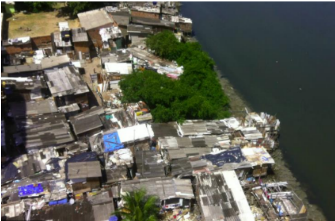
Figura 5: Coelhos.

processo de disputa na justiça, imóveis comerciais ou institucionais, fora da metragem permitida pela Lei do PREZEIS e imóveis com moradores que não desejam participar deste processo.