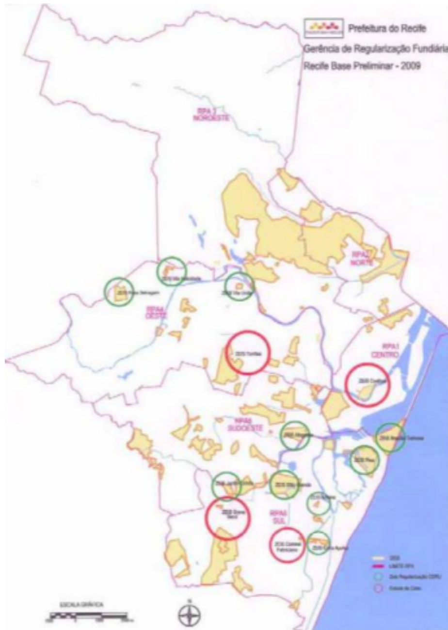
Figura 3: ZEIS do Recife com destaque daquelas com regularização fundiária com o instrumento jurídico de Concessão de Direito Real de Uso ± CDRU.

Fonte: Gerência de Regularização Fundiária ± Prefeitura do Recife/Informações sobre regularização fundiária.